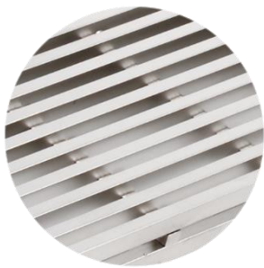
Schwerlast-Gully-Stabrost Hydra Linearis 7x7 mm