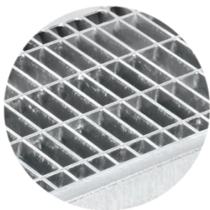
Schwerlast-Gully-Maschenrost feuerverzinkter Stahl