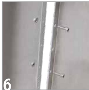
6 Um eine maximale Stabilität zu gewährleisten, müssen nicht alle Bohrungen der Flansche mit Schraubverbindungen versehen werden.*