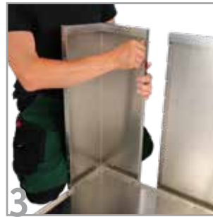
3 Das erste Seitenteil wird mit Schrauben am Anschlussflansch der Ecke fixiert.*