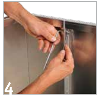
4 Für die Montage benötigen Sie einen 5er Innensechskant sowie einen 10er Maulschlüssel.