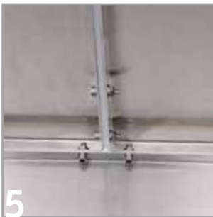
5 Hier sehen Sie eine Ansicht fertig montierter Boden- und Seitenflansche.