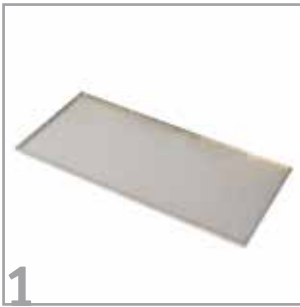
1 Zuerst positionieren Sie die Bodenplatte des Pflanzkastens.