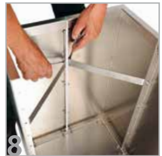
8 Die quer innerhalb der Ecken verlaufenden Zugstreben im oberen Bereich des Pflanzkastens erhalten auch den nötigen Freiraum für die im Anschluss der Montage erfolgende Bepflanzung.