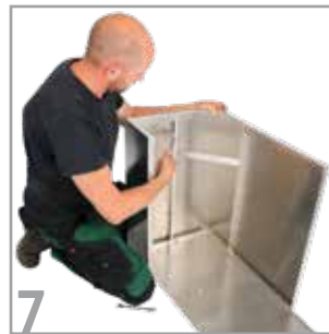
7 Zusätzliche Stabilität bekommen die Pflanzkästen über Zugstreben, welche über die Flansche der Ecken verlaufen.