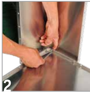
2 Danach kann die erste Ecke mittels Schraubverbindung mit der Bodenplatte verbunden werden.